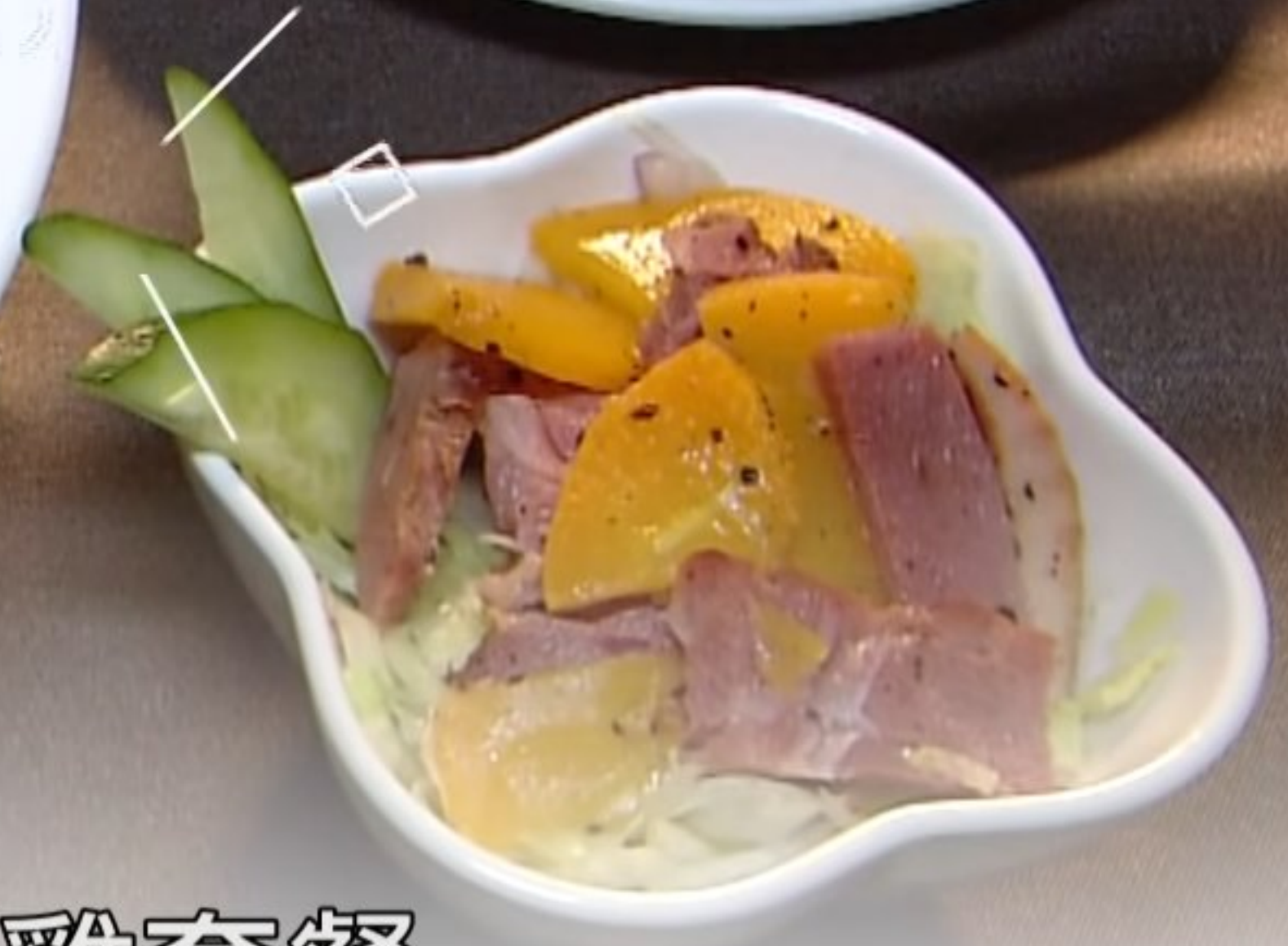
還有這個叫水手照燒雞套餐